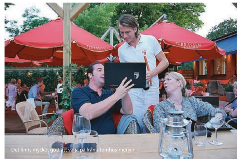
Det finns mycket gott att välja på från utomhus-meny.