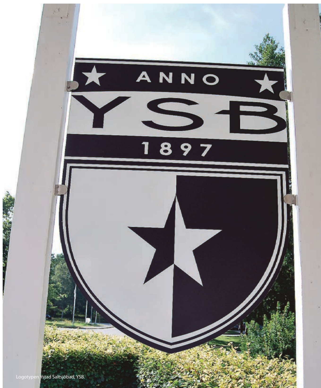
Logotypen Ystad Saltsjöbad, YSB.

Att vakna till vågnas brus Boendet är varierande och finns uppdelat i olika rumskategorier. 109 rum varav 1 rejäl svit och 6 minisviter ser till att gästerna är avkopplade och utvilade när de checkar ut. Vårt rum vetter mot det öppna havet och med den lilla franska balkongen slår vågbruset in i rummet när man slår upp ögonen på morgnen. Även om vissa rum är ganska små, så tycker jag ändå att inredningen i marin stil och den fantastiska utsikten kompenserar detta gott och väl.