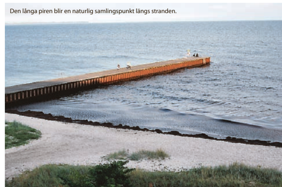
Den långa piren blir en naturlig samlingspunkt längs stranden.