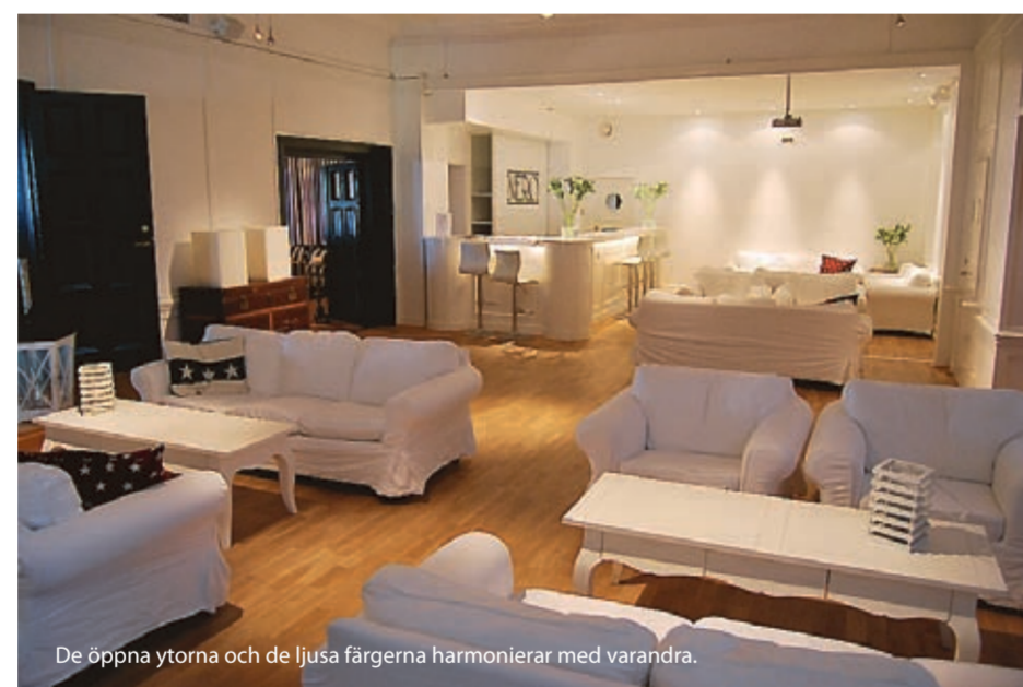
De öppna ytorna och de ljusa färgerna harmonierar med varandra.