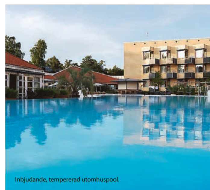
Inbjudande, tempererad utomhuspool.