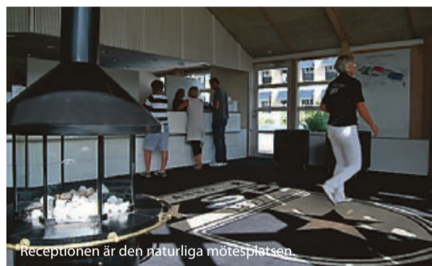
Receptionen är den naturliga mötesplatsen.