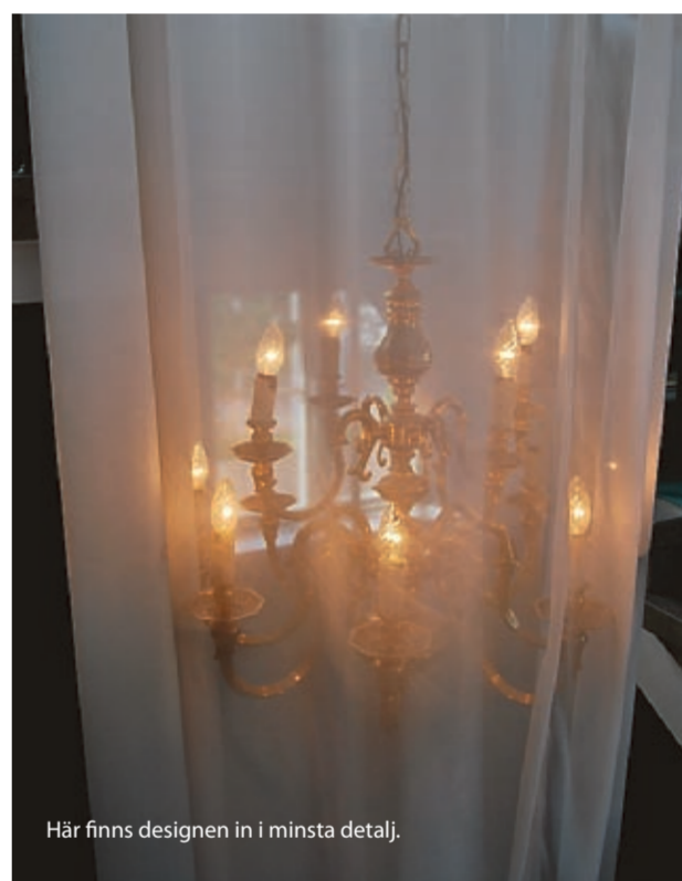
Här finns designen in i minsta detalj.