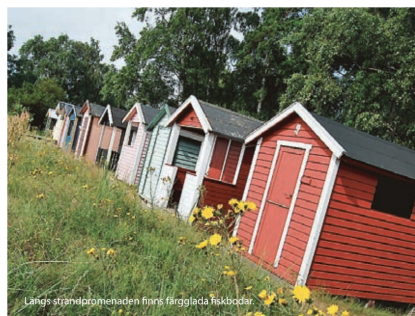
Längs strandpromenaden finns färgglada fiskbodar.

Något som vore spännande att prova nästa gång är rummen som har egen balkong.