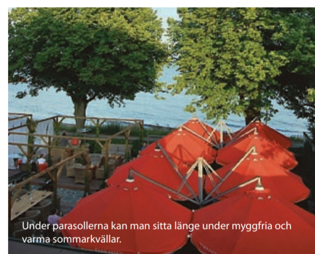
Under parasollerna kan man sitta länge under myggfria och varma sommarkvällar.