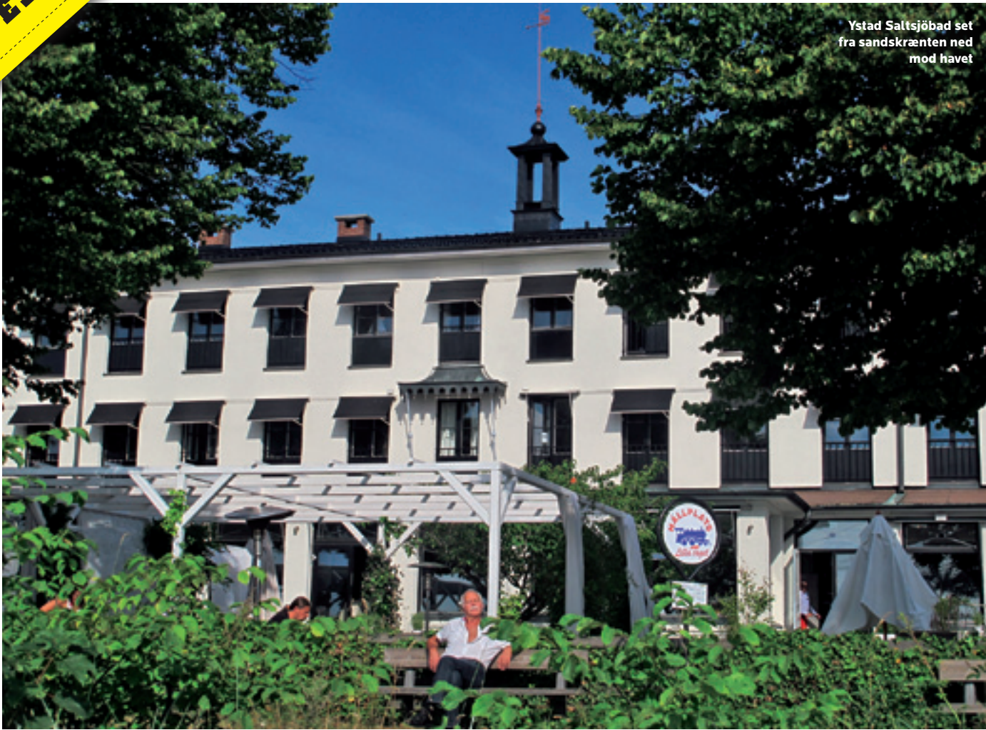
Ystad Saltsjöbad set fra sandskrænten ned mod havet