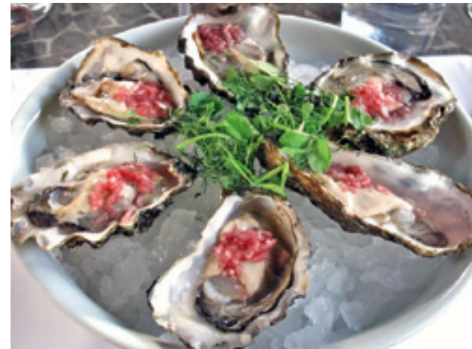
Herover de lækre osters på Terrassen og nederst stranden mod øst

Kør enten over Øresundsbroen, www.oresundsbron.com , eller tag med en af Scandlines færger fra Helsingør til Helsingborg. Mere på www.scandlines.dk .