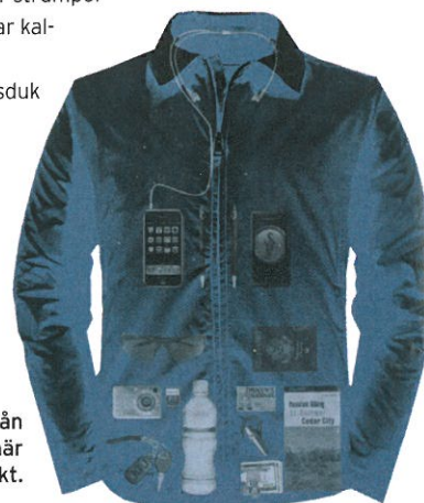
37 fickor har jackan från Scottevest – räddningen när bagagevägen skriker övervikt.