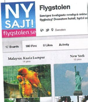
Flygstolen gillar Pinterest.