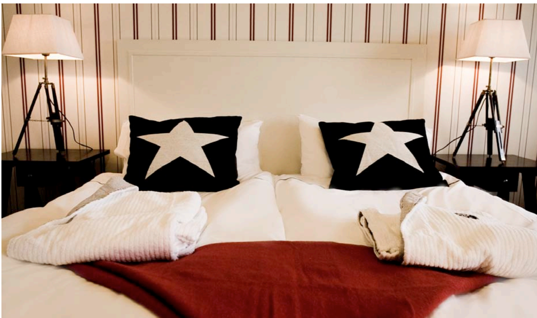
En stram design-tråd gennemsyrrer hele hotellet. Og badekåberne er varme og bløde.