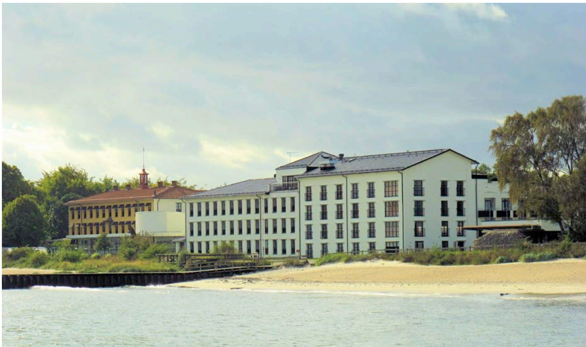
Ystad Saltsjöbad har gennem mange generationer været et af svenskernes foretrukne refugier - både sommer og vinter. Hotellet er spækket med originale fotos af badelivet her på kysten siden 1890'erne.