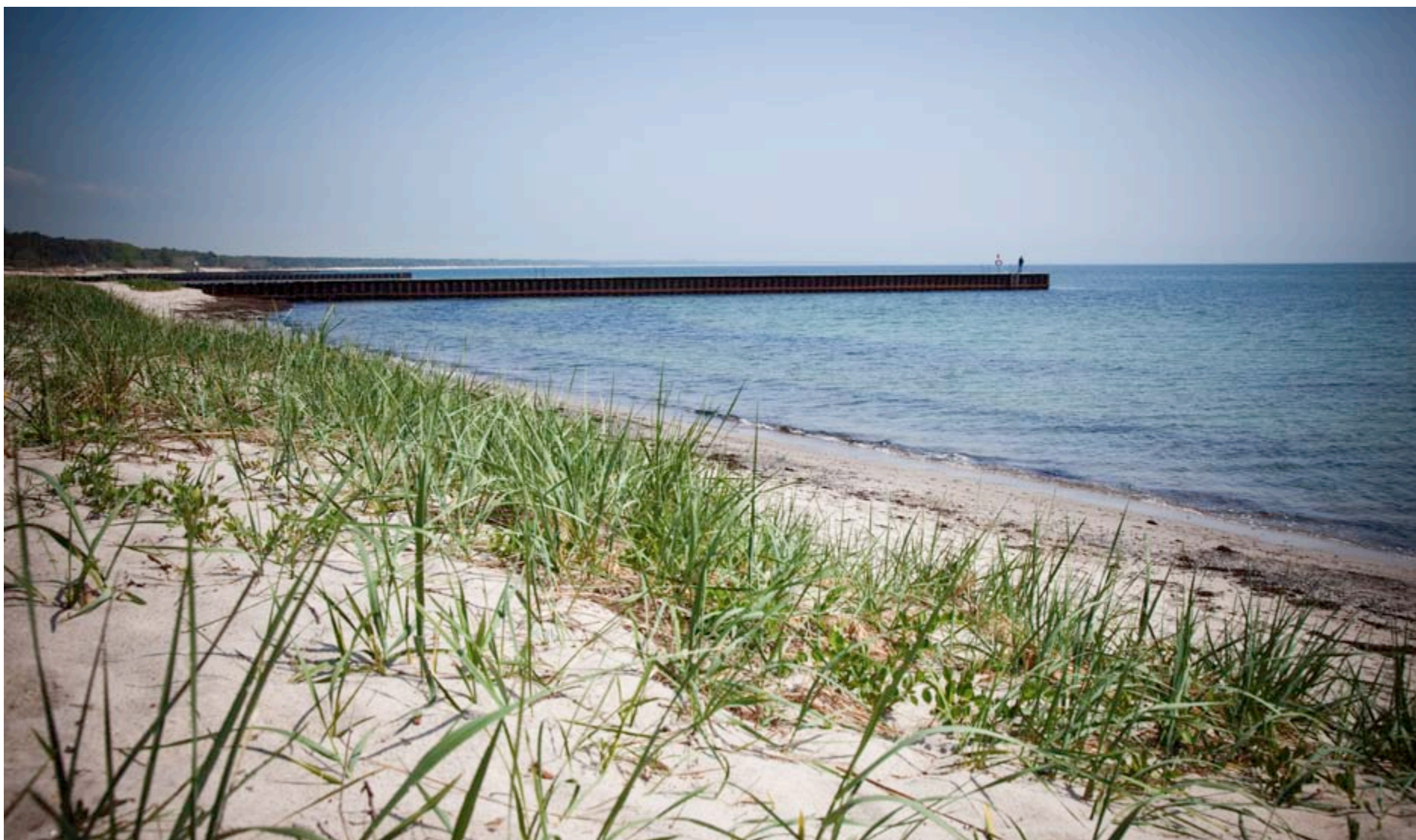
Øst for saltsjöbadet strækker den brede vide sandstrand sig nogle kilometer. Oplagt til en forfriskende gåtur.