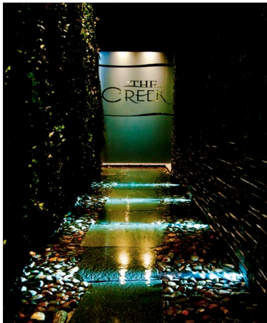
Indgangen til den nyåbnede spa, hvor man for et par timer totalt glemmer hverdagens genstridigheder.

Importer en kølig flaske champagne og to langstilkede glas fra Danmark og del den med din udkårne nede på stranden eller yderst på bugtens flotte, lange moler før middagen