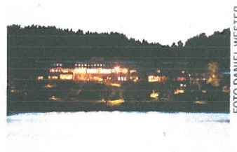
Vann ceremoni, Brastad, från 450 kr. www.vann.se