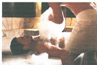
Sturebadets sparitual, Stockholm från 895 kr. www.sturebadet.se